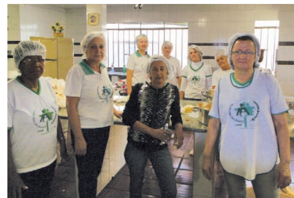
Líderes acolhem as caravanas.

Líderes do Setor Foz do Iguaçu se uniram para fazer a acolhida e preparar o Café da Manhã para as caravanas que chegaram em Foz do Iguaçu para o evento cristão-muçulmano “Maria exemplo para todos nós”. Com alegria e disposição, os líderes acolheram cerca de 1500 pessoas no salão da Paróquia São Paulo Apóstolo. Parabéns a todos que colaboraram nessa bonita iniciativa.