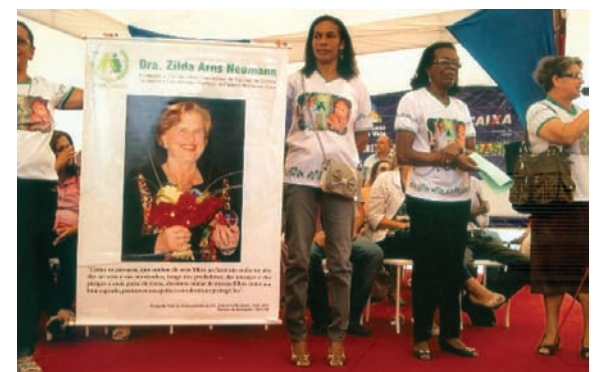
Zilda Arns: nome do Conjunto Residencial.

Os familiares das crianças acompanhadas pelos nossos líderes, especialmente as mães, aprendem a valorizar e a trabalhar com vigilância nutricional, a identificar problemas de desnutrição, fortalecer o aleitamento materno, alimentação saudável, controle de doenças respiratórias e diarreias, uso do soro caseiro, prevenção de acidentes domésticos, e outras ações que propiciam