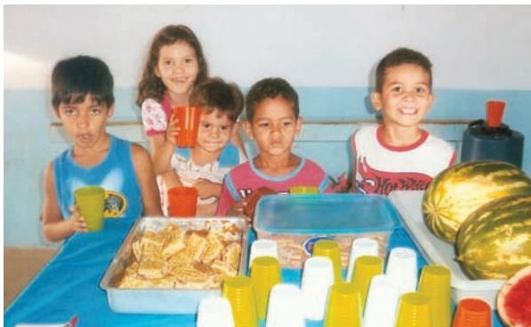
Comunidade se reúne para celebrar a vida.

A Celebração da Vida reuniu coordenadora, líderes, crianças e gestantes. Com todo o entusiasmo, esse grande dia celebrou as vitórias e conquistas de cada criança e gestante acompanhada. Agradeço a Deus pela colaboração dos líderes e equipe de apoio de nossa comunidade, pois sabemos que salvar vida é dom de Deus.