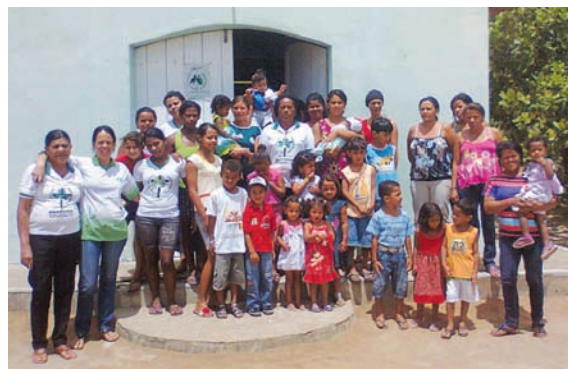
Comunidade na Celebração da Vida.

A Pastoral da Criança de Bom Conselho realizou neste mês de Fevereiro 2012 uma linda Celebração da Vida, na Comunidade de Queimada Grande. Os líderes cadastraram novas famílias e pesaram as