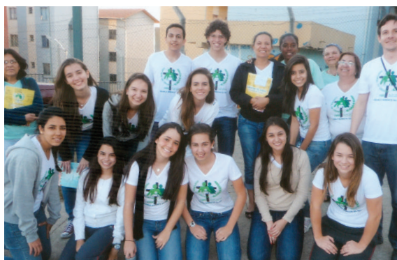
Estudantes aprendem mais sobre a Pastoral da Criança.

No final do ano, foi feita uma avaliação com a participação da diretoria do colégio,