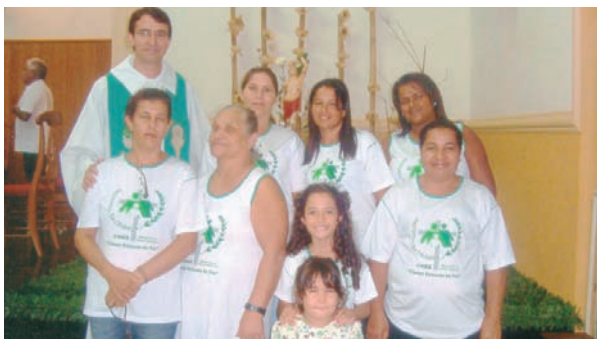
Testemunho de amor e fé.

Há 17 anos faço parte da Pastoral da Criança na Paróquia Santana, em Coromandel, na Diocese de Patos de Minas. Participei como líder durante anos, depois com um problema de saúde que veio a acontecer perdi a visão. Fiquei cega, mas continuo firme e hoje participo como assessora espiritual na Pastoral da Criança. Talvez seja esse o aprendizado mais difícil: manter o movimento permanente, a renovação constante, a vida vivida como caminho e mudança.