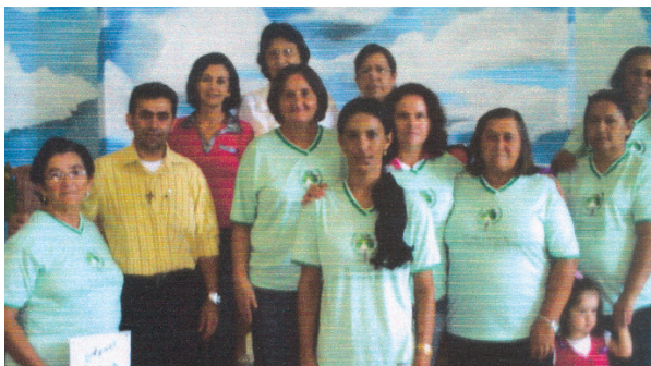
Líderes recordam Dra. Zilda.