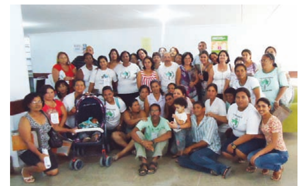
Coordenadores participam de Assembleia.